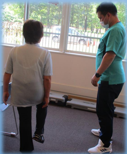
↑ 身体測定の再評価