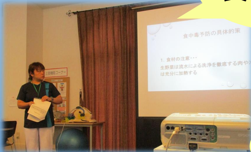
↑ 看護師さんによる講話